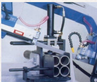
Opcija: uređaj za zatezanje snopa ARG DF NC – ARG 300 CF NC