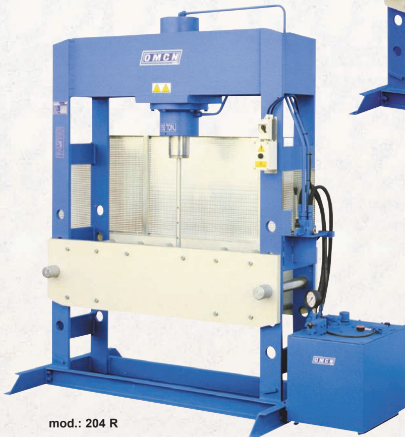
mod.: 204 R