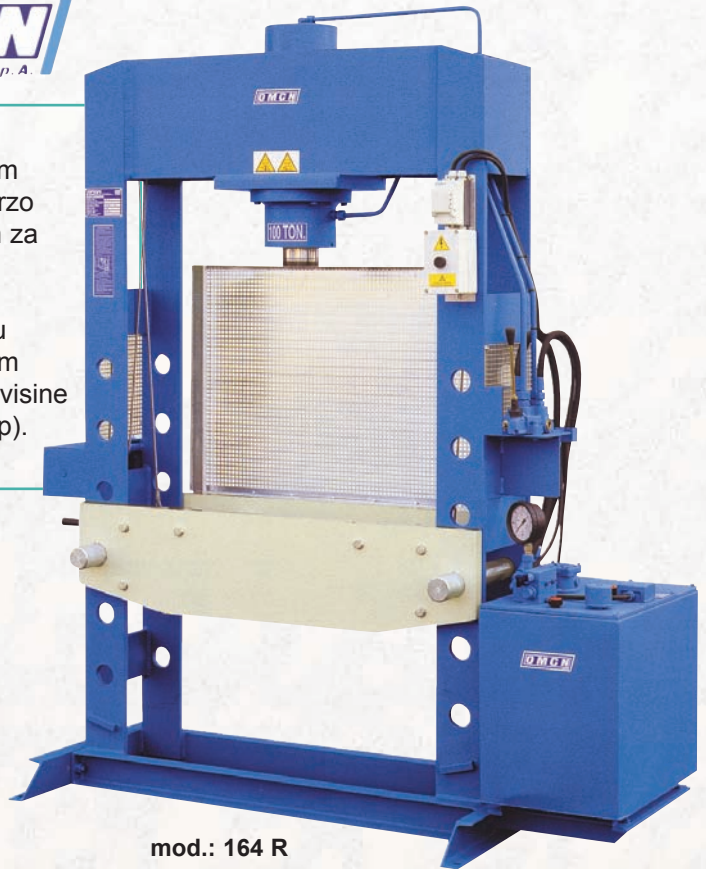
mod.: 164 R

Svi uređaji imaju trosmjerni ventil i ventil za regulaciju (pomak, prazni hod, vraćanje), kao i uljno punjenje. Svi su modeli u svrhu podešavanje visine stola opremljeni ručnim užnim vitlom, s izuzetkom modela 204/RE (podešavanje visine stola pomoću šipke za podizanje koju treba ušarafiti u klip). Klipovi su od poboljšanog kromiranog specijalnog čelika.